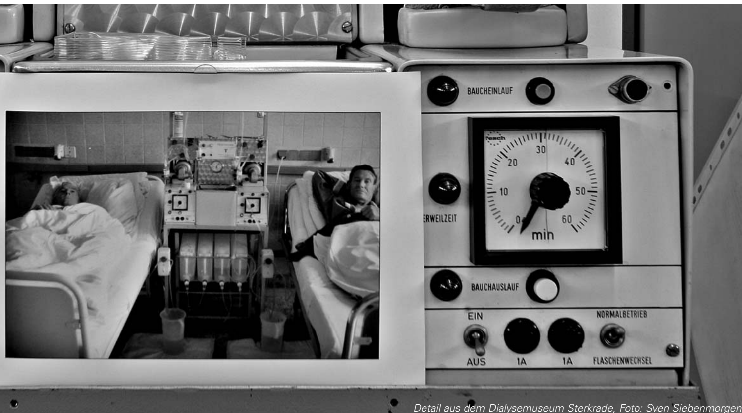
Detail aus dem Dialysemuseum Sterkrade